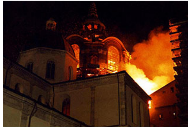
Incendio del 1997 nella Cappella del Guarini

Indubbiamente la naturale enfasi di quei momenti drammatici e l'eco dei mass media, hanno caratterizzato quel salvataggio con toni anche mistici: ma era inevitabile, fa parte della cultura della Sindone, della sua tradizione, della sua storia. Infatti non è la prima volta che il sudario è vittima del fuoco: sicuramente il 4 ottobre 1532 fu salvato a stento dall'incendio che aveva avvolto la cappella di Chambéry in cui era conservato, riportando però alcuni danni ben visibili. Si dice inoltre che la Sindone anche in altre occasioni abbia rischiato di essere bruciata, ma le prove a sostegno sono scarse e non sempre riescono a reggere la critica storica.