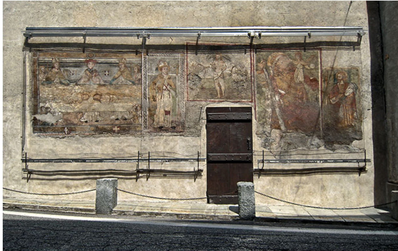
Affresco Sindonico a Voragno in Val di Lanzo, situato su un lato esterno della cappella dedicata ai Santi Lorenzo e Sebastiano

La Sindone fotografata da Giuseppe Enrie nel 1931.