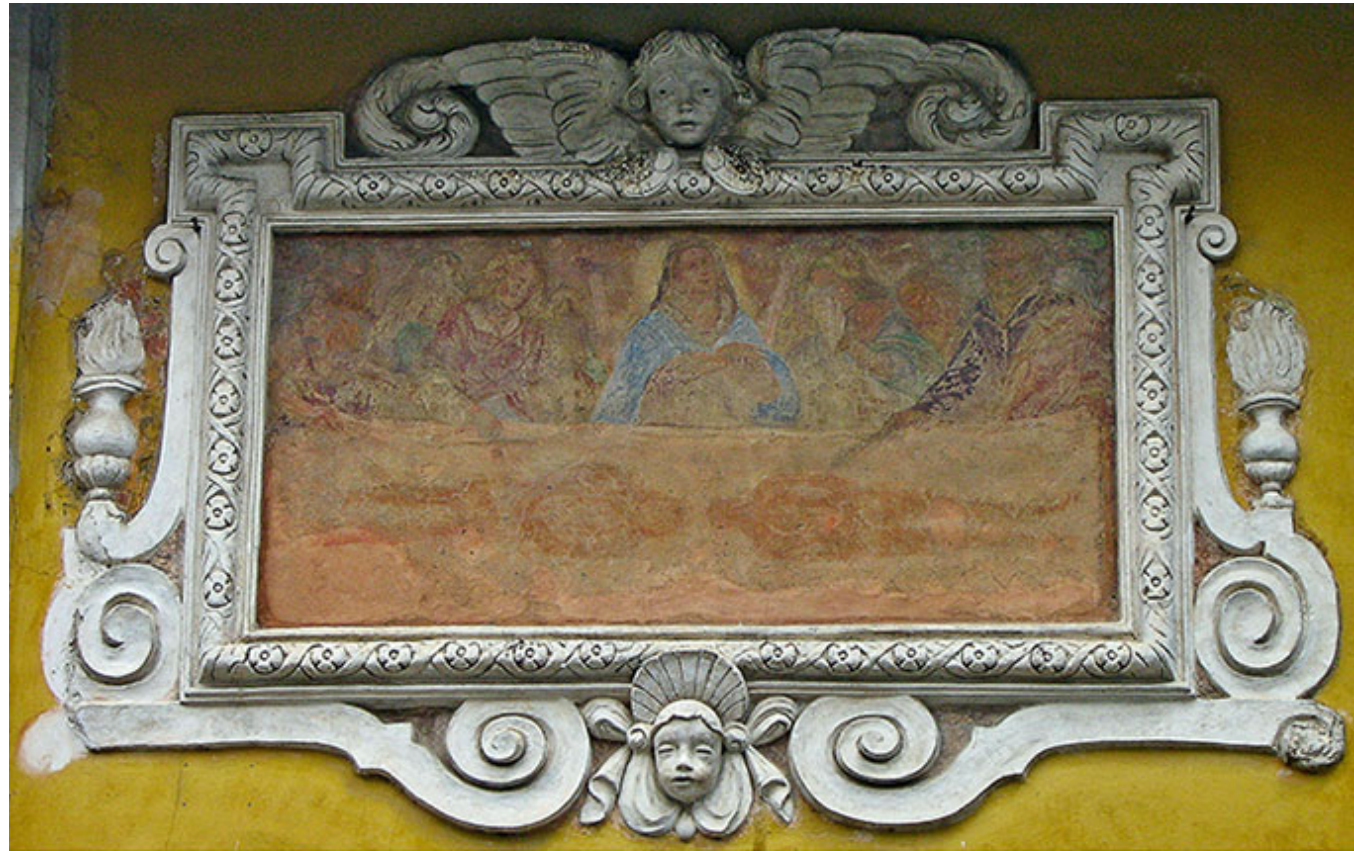
Chieri - Casa privata in via San Giorgio, 17

Con il ridursi delle epidemie di peste e del potere dei Savoia, anche il culto della Sindone andò via via perdendo la propria antica solidità: l'iconografia è l'ultima traccia visibile di una forma di culto ormai quasi totalmente dimenticata. Inoltre, va considerato che l'affermazione della fotografia ebbe un ruolo fondamentale nella diffusione della Sindone, determinando di contro una riduzione delle riproduzioni dipinte, copie e altre forme di raffigurazione della reliquia.