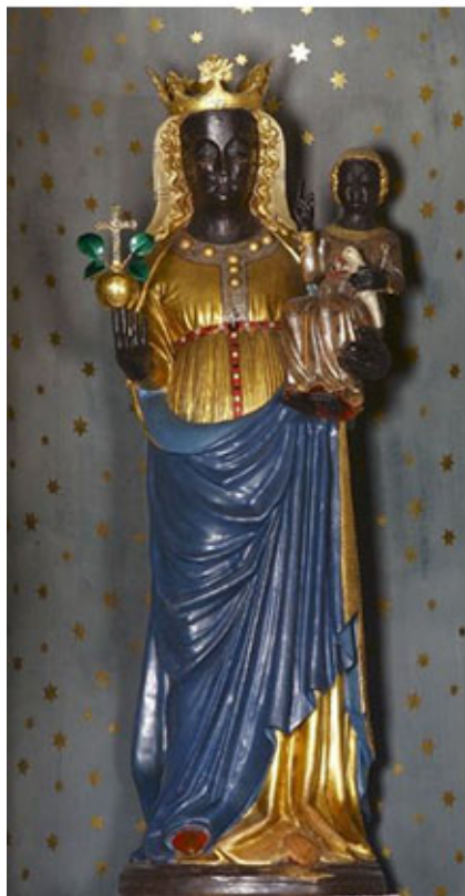
Madonna Nera d'Oropa

di congiunzione tra persone, luoghi e periodi diversi.