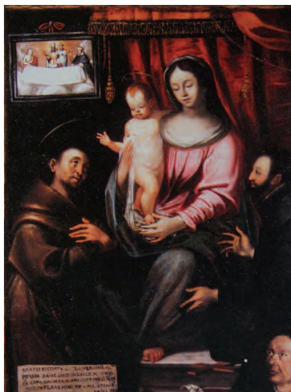
1650 circa, Biella (Bi), Santuario Madonna di Oropa. Si legge sul cartiglio: