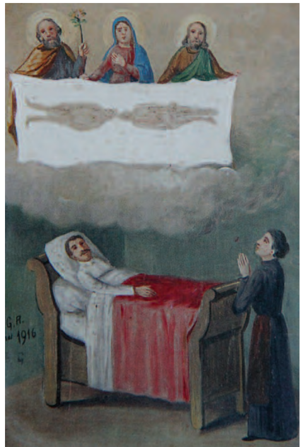
1916, Casalgrasso (Cn), Santuario Madonna delle Grazie