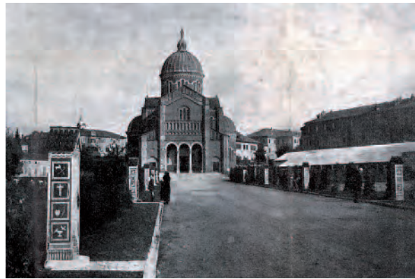
1934, Asti, inaugurazione del viale che porta al Santuario Madonna del Portone e santelle della via Crucis (ora sono state spostate nei pressi del santuario)[fonte Ecclesia, 1962]