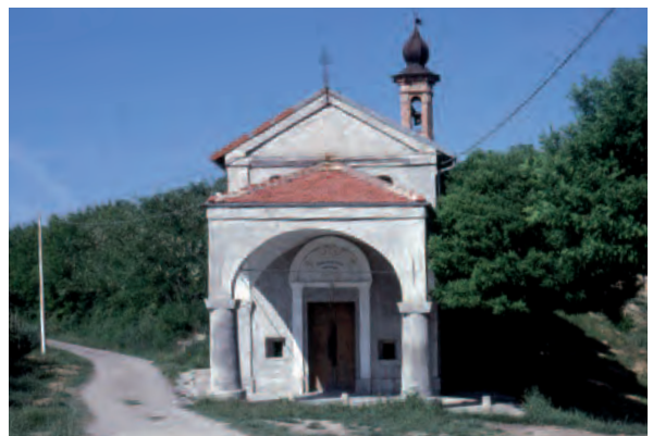
Mango (Cn), Cappella Madonna delle Grazie [foto R. Grimaldi, 1987]