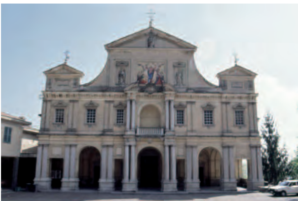
Serralunga di Crea (At), Santuario Madonna di Crea [foto A. Brunero, 1990]