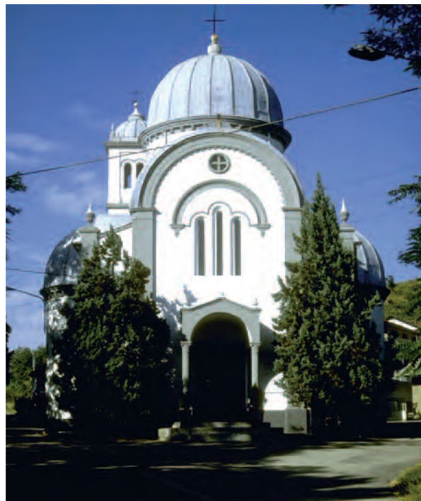
Cassinasco (At), Santuario Madonna dei Caffi