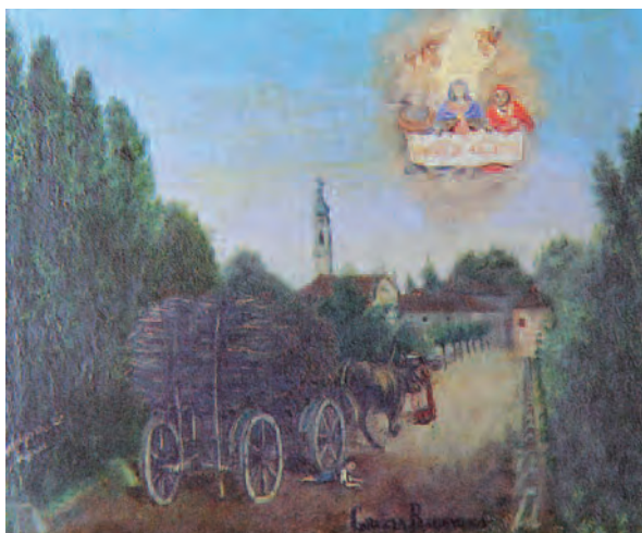
1930 circa, Casalgrasso (Cn), Santuario Madonna delle Grazie

lano, città in cui nel 1536 avvenne una documentata ostensione. A Torino arriverà soltanto più tardi, fra il 1536 e il 1578 – epoca di Emanuele Filiberto – data quest'ultima in cui c'è la prima ostensione. Carlo Borromeo intraprende da Milano il famoso pellegrinaggio e visita la Sindone nel vestibolo della chiesa di S. Lorenzo (lo dichiara una lapide che ricorda questo importante evento; la chiesa invece fu costruita posteriormente, nel Seicento, da Guarini); la Cappella in Duomo nel 1578 era stata appena progettata ma non ancora costruita. Dal 1578 in avanti, in molte località del Piemonte (dalla Valsesia al Biellese alla Valle di Susa; poi sino alla Val d'Aosta) si diffonde l'immagine della Sindone sulle facciate esterne delle case, nelle pale d'altare, negli ex voto.