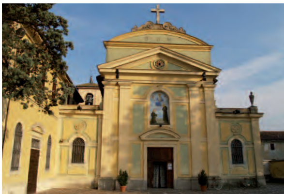
Casale Monferrato (Al), Santa Maria del Tempio