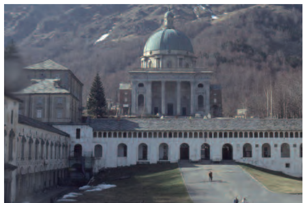
Biella (Bi), Santuario Madonna di Oropa