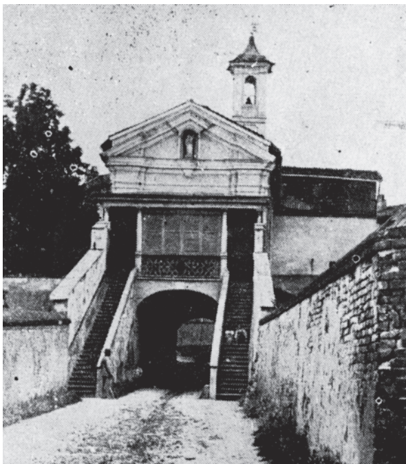
Asti, Tempio del Portone costruito sulle mura che cingevano la città così come si presentava dal 1700 al 1900, su cui è stato poi costruito il Santuario della Madonna del Portone