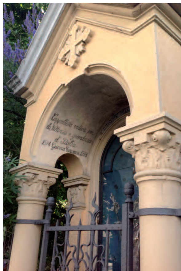
1918, Asti, Pilone dedicato a San Giuseppe in viale dei Partigiani. Si legge: «Cappelletta votiva per la Vittoria e grandezza d'Italia. 1914 Guerra Europea 1918»

interventi chirurgici. Varia è anche la tipologia degli incidenti accorsi ai devoti: incidenti causati dai mezzi di trasporto, incidenti sul lavoro, pericoli di guerra, scatenarsi delle forze naturali, incidenti caratteristici del mondo contadino, rischi relativi al bestiame e agli animali in genere, così importanti per l'economia contadina degli anni passati. Si annoverano inoltre gli ex-voto di naufragi, i quali specificano sempre i nomi del padrone dell'imbarcazione, l'equipaggio soccorritore, giorno e ora del naufragio e il salvataggio e sono assai numerosi nelle cittadine di porto (Tripputi, 1977). Le tavole dipinte nelle quali invece appare l'offerente ma non il fatto si possono definire con «voto segreto»: comprendono infatti le richieste che coinvolgono la sfera più intima dell'uomo, le necessità spirituali o quelle che comunque si preferisce non comunicare, in cui il supplicante è ritratto solo o con i familiari, ma non viene specificato l'accaduto (Grimaldi, 1995).