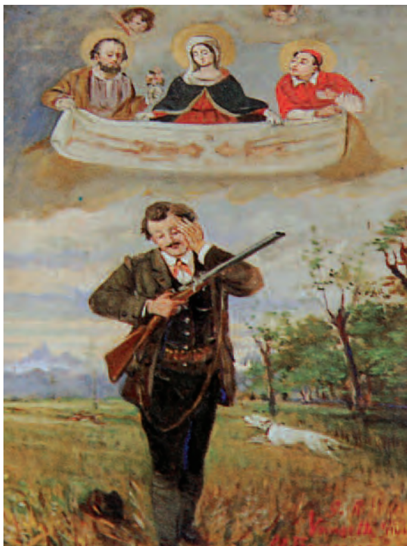
1918, Casalgrasso (Cn), Santuario Madonna delle Grazie