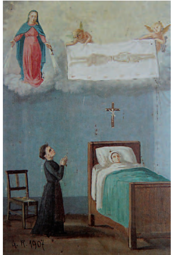
1907, Casalgrasso (Cn), Santuario Madonna delle Grazie