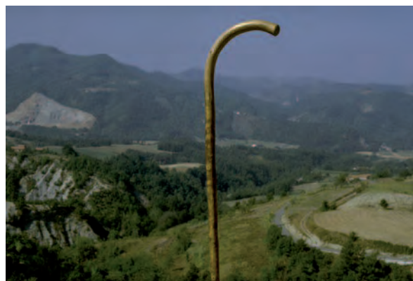
1347, 14 settembre, Ponzone (Al), Nostra Signora della Pieve. Bastone del pellegrino consegnato come ex-voto

Esistono da sempre diverse tipologie di forme di ex-voto ed entrando in un santuario emerge chiaramente la fantasia che l'uomo adotta nella pratica devozionale: qualunque oggetto può divenire ex-voto a seconda del significato che l'offerente gli imprime (Borello, 1982). Per semplificare possiamo affermare che esistono due macro tipologie di ex-voto materiali: oggettuali e dipinti. Gli ex-voto oggettuali si caratterizzano per l'esistenza di numerose, se non infinite, tipologie, mentre gli ex-voto dipinti esprimono una ricchezza pittorica espositiva che consente di formulare numerose riflessioni, nei più svariati ambiti di studio, di tipo tecnico-