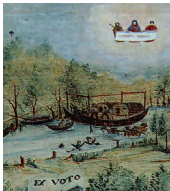
1930 circa, Casalgrasso (Cn), Santuario Madonna delle Grazie (particolare)

In conclusione, la Sindone ha una presenza numericamente limitata nel nostro corpus votivo – come era prevedibile – ma ha comunque lasciato tracce qualitativamente importanti nel nostro territorio a testimonianza della forza che il culto sindonico ha avuto nei comportamenti devozionali in Piemonte.