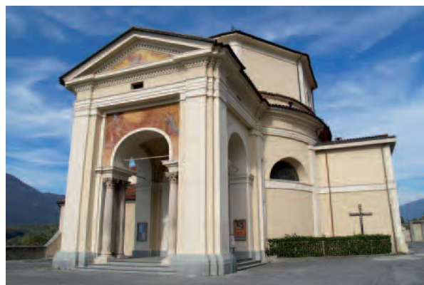
Avigliana (To), Santuario Madonna dei Laghi

profumano di torrone e si riempiono dell'eccitazione dei giovani che rompono le pignatte e scalano l'albero della cuccagna, della voce del banditore che estrae i numeri della lotteria che mette in premio il tradizionale foulard.