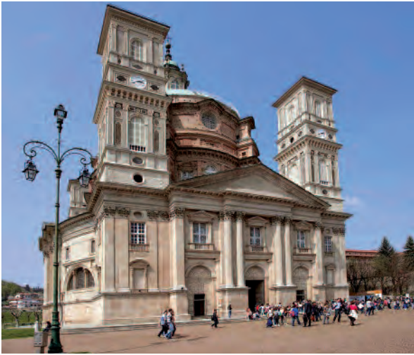
Santuario di Vicoforte, nei pressi di Mondovì (Cn), dedicato a "Maria Santissima del Montereale", che vanta la cupola ellissoide più grande al mondo. Sulla fine del Cinquecento i pellegrini in visita al pilone votivo miracoloso aumentano al punto che un manoscritto, conservato nell'archivio del santuario, riferisce per il 1595 della presenza di persone e compagnie religiose provenienti da oltre 450 località piemontesi diverse