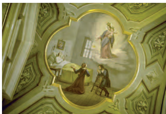
1987, Molare (Al), Santuario Madonna delle Rocche. Miracolo affrescato sulla volta del santuario