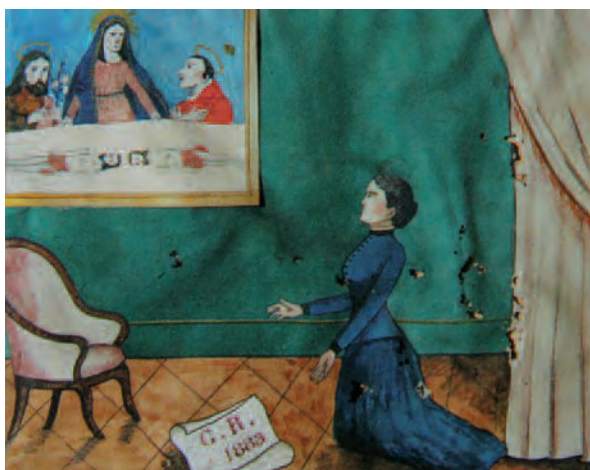
1883, Casalgrasso (Cn), Santuario Madonna delle Grazie

segreto che riporta a tutto campo l'ostensione del sacro lenzuolo, infine la comunità viene raffigurata in chiesa in un momento di preghiera e in atto di ringraziamento verso il dipinto sindonico che si trova dietro l'altare maggiore.