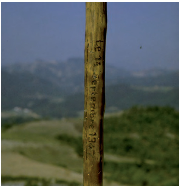
1347, 14 settembre, Ponzone (Al), Nostra Signora della Pieve. Particolare del bastone del pellegrino portante incisa la data in lingua francese

artistico, umanistico, fino a considerazioni di tipo prettamente teologico. L'ex-voto oggettuale non racconta la grazia, ma è concepito come segno di ringraziamento destinato direttamente alla divinità, che sa cosa è avvenuto, e non è sentita la necessità di rendere pubblico l'avvenimento accaduto. Esso implica d'altro canto un maggior senso di rinuncia, poiché si offre un oggetto che ha particolare valore affettivo per la persona, la quale ha come unico desiderio principale collocare l'oggetto accanto all'icona dell'intercessore (Borello, 1982).