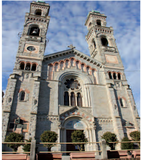
Giaveno (To), Santuario del Selvaggio (ovvero "dei salvati" dalla peste)