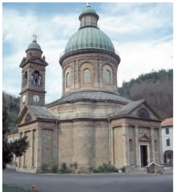
Millesimo (Sv), Santuario Nostra Signora del Deserto