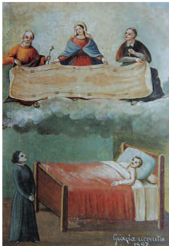
1897, Casalgrasso (Cn), Santuario Madonna delle Grazie

segreto che riporta a tutto campo l'ostensione del sacro lenzuolo, infine la comunità viene raffigurata in chiesa in un momento di preghiera e in atto di ringraziamento verso il dipinto sindonico che si trova dietro l'altare maggiore.