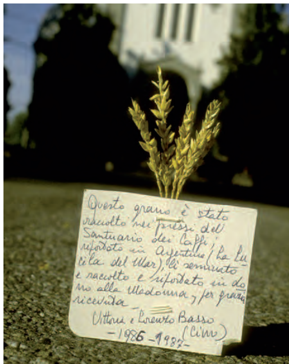
1987, Cassinasso (At), Santuario Madonna dei Caffi. Spighe di grano portate dall'Argentina come ex-voto

Numerosi poi sono le radiografie, o gli esiti e le diagnosi mediche offerte in santuario a testimonianza della risoluzione di un evento negativo. L'ultima frontiera votiva è dettata dall'irrompere delle tecnologie infotelematiche nella quotidianità della vita sociale: navigando in rete sono numerosi i siti dedicati alla devozione, in cui possono offrire le proprie intenzioni e le proprie preghiere, condividere e testimoniare la propria esperienza. Con l'evolvere e i cambiamenti sociali e culturali cambia inevitabilmente anche la forma dell'ex-voto, rimane però invariata la funzione ad esso attribuita.