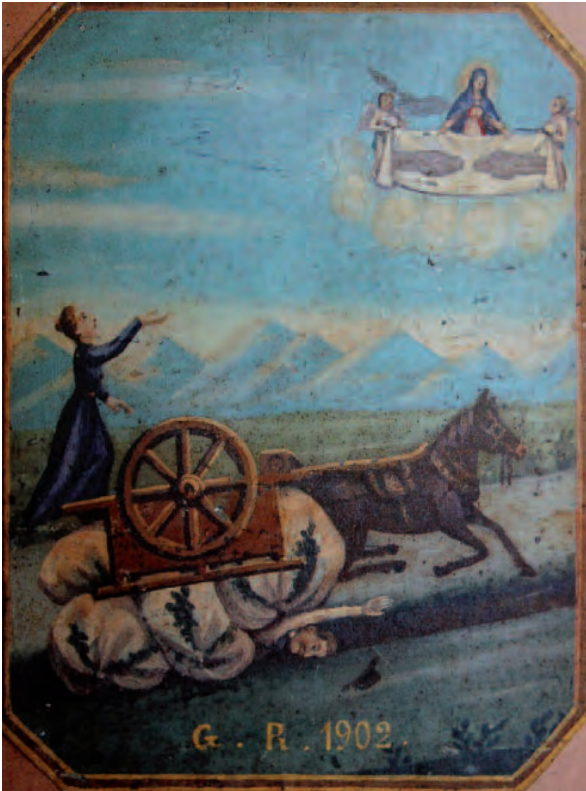
1902, Bene Vagienna (Cn), Cappella del Santo Sudario