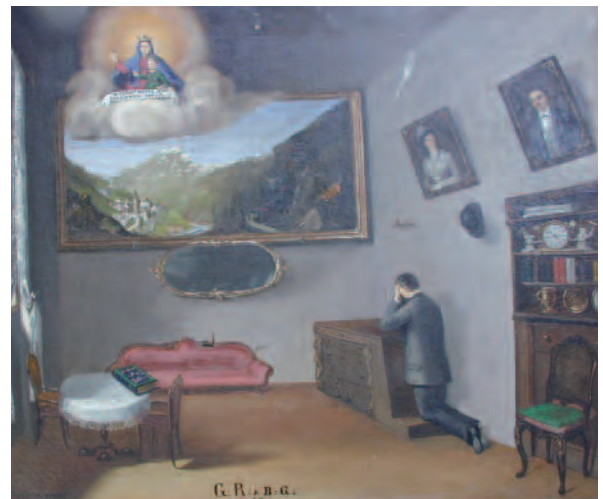
1900 circa, Re (Vb) , Santuario Madonna del Sangue. Orante in un interno di una casa borghese

Tali casi evidenziano rispettivamente due strategie di comportamento: una di tipo egoistico, in cui l'attore chiede per se stesso una grazia, dunque l'attore richiedente coincide con il destinatario stesso della grazia, denominata strategia di individuazione , e una di tipo altruistico, in cui l'attore protagonista della tavoletta votiva chiede la grazia per un'altra persona, che chiameremo strategia di identificazione (Grimaldi, 1995).