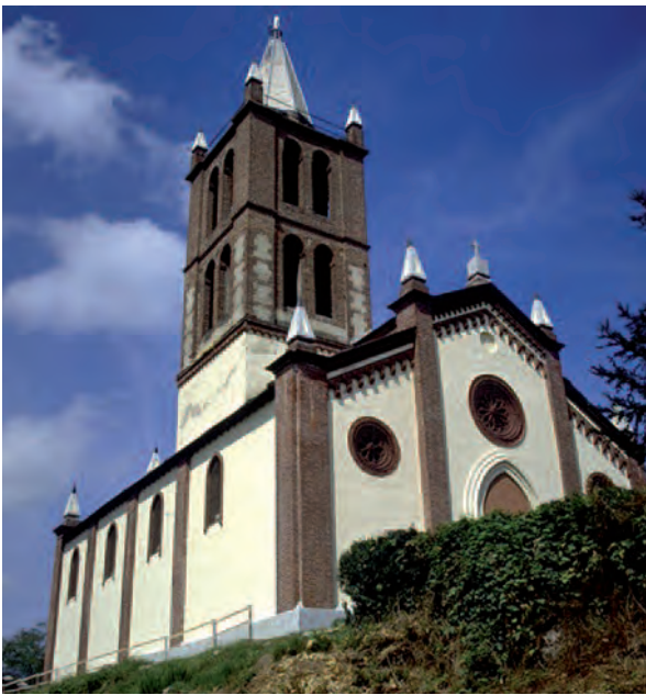
Garzigliana (To), Santuario Madonna di Monte Bruno