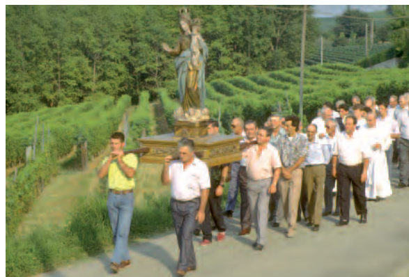
Costigliole d'Asti (At), Santuario Beata Vergine delle Grazie (La Madonnina). Prima domenica di agosto, processione attraverso i campi e le vigne [foto R. Grimaldi, 1990]

Molte volte la strada che porta immediatamente al santuario è corredata di piloni con la Via crucis, una via dolorosa con forme penitenziali che portano all'assoluzione di peccati più gravi sottratti ai confessori comuni. Attorno ai santuari si creano servizi per i pellegrini, da ospizi a vere e proprie case di cura, mentre per quelli internazionali si sono create organizzazioni per i vari mezzi di comunicazione destinati alle masse (autobus, treni, ecc.). Non è raro che presso il santuario viva un eremita (romitaggio); tracce della presenza di un eremita si possono vedere ad esempio al Santuario del Pino di Demonte (Cn). Di solito i santuari si trovano in oasi naturali anche se esistono esempi di importanti santuari cittadini.