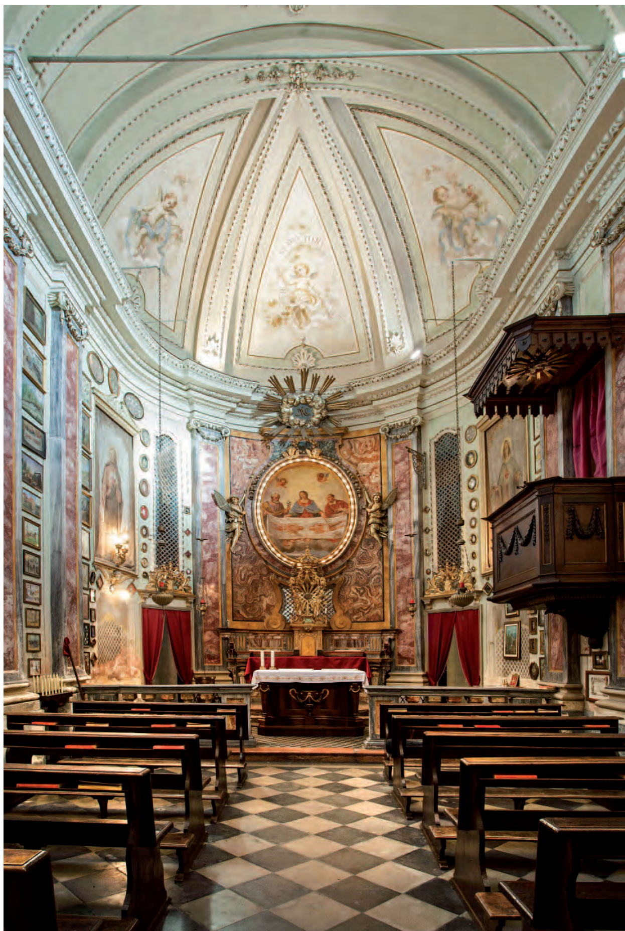
Casalgrasso (Cn), Chiesa della Madonnina. Il dipinto che si trova dietro l'altare maggiore rappresenta l'ostensione della Sindone ad opera di S. Giuseppe, la Madonna e S. Carlo Borromeo, a protezione del paese rappresentato in basso; ai lati sono appesi quadri votivi