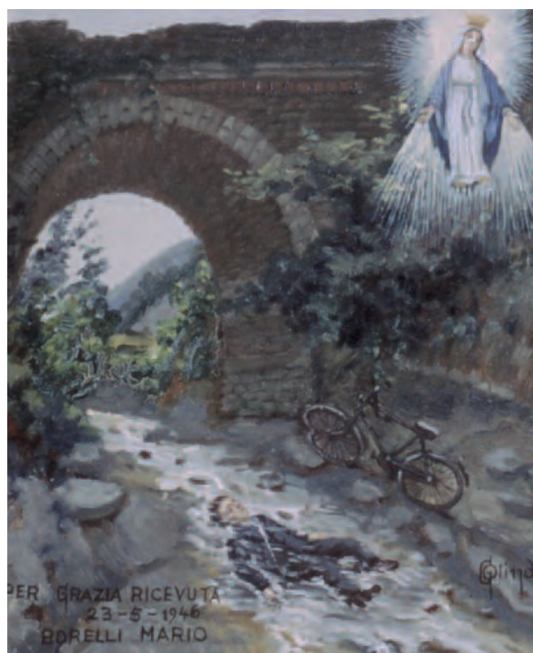
1946, 23 maggio, Cassinasco (At), Santuario Madonna dei Caffi. Il pittore Giovanni Olindo ha raccontato che il miracolato ha voluto che dipingesse l'ex-voto riproducendo esattamente il luogo dove il graziato è caduto con la bicicletta; ha pure raccontato che una donna non ha ritirato il quadro commissionato dato che riteneva che il viso della figlia miracolata non fosse stato dipinto sufficientemente somigliante, e dunque non fosse riconoscibile dal santo e dalle persone che poi avrebbero visto l'ex-voto (Grimaldi, 1980)

Le situazioni rappresentate nelle tavolette votive dipinte sono dunque molteplici e ci restituiscono uno spaccato di vita vissuta che muta nei secoli, evidenziando caratteristiche, usi e costumi, che lo rendono un veicolo importante di trasmissione socioculturale e di memoria.