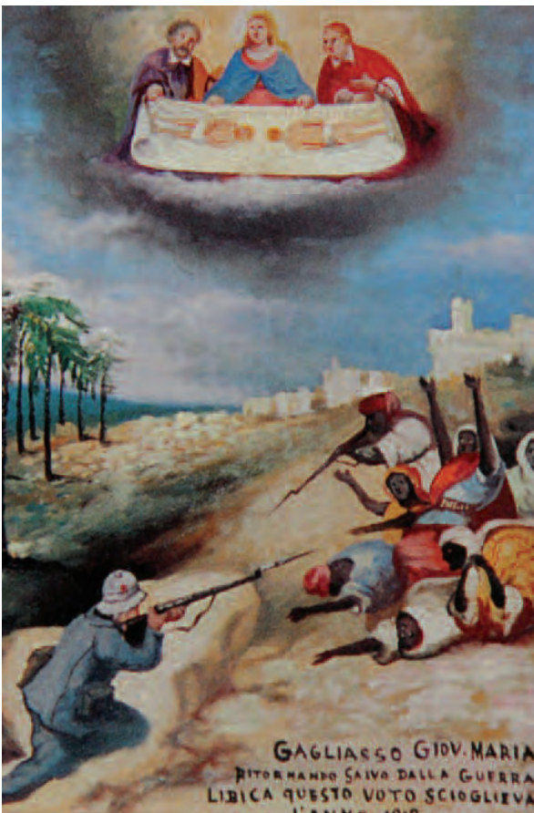
1913, Casalgrasso (Cn), Santuario Madonna delle Grazie