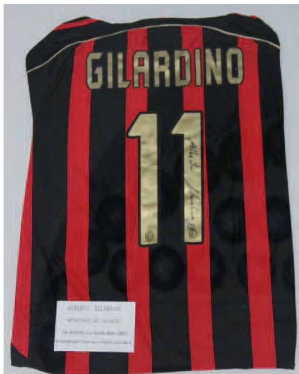
2007, Biella (Bi), Santuario Madonna di Oropa. Maglia di calciatore; sul cartiglio si legge: «Alberto Gilardino / del Milan A.C. / con devozione alla vergine Bruna d'Oropa / in occasione della vittoria della Champions League 2006-07»