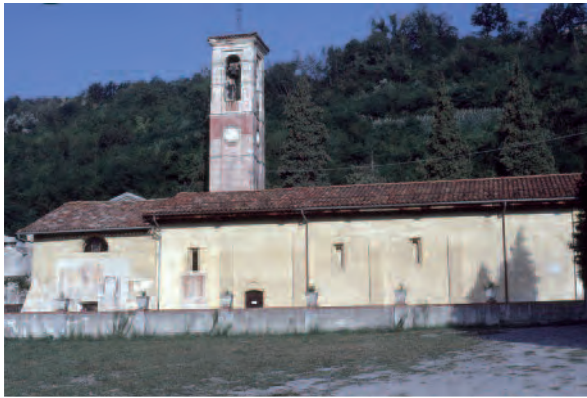
Bastia Mondovì (Cn), Chiesa di S. Fiorenzo