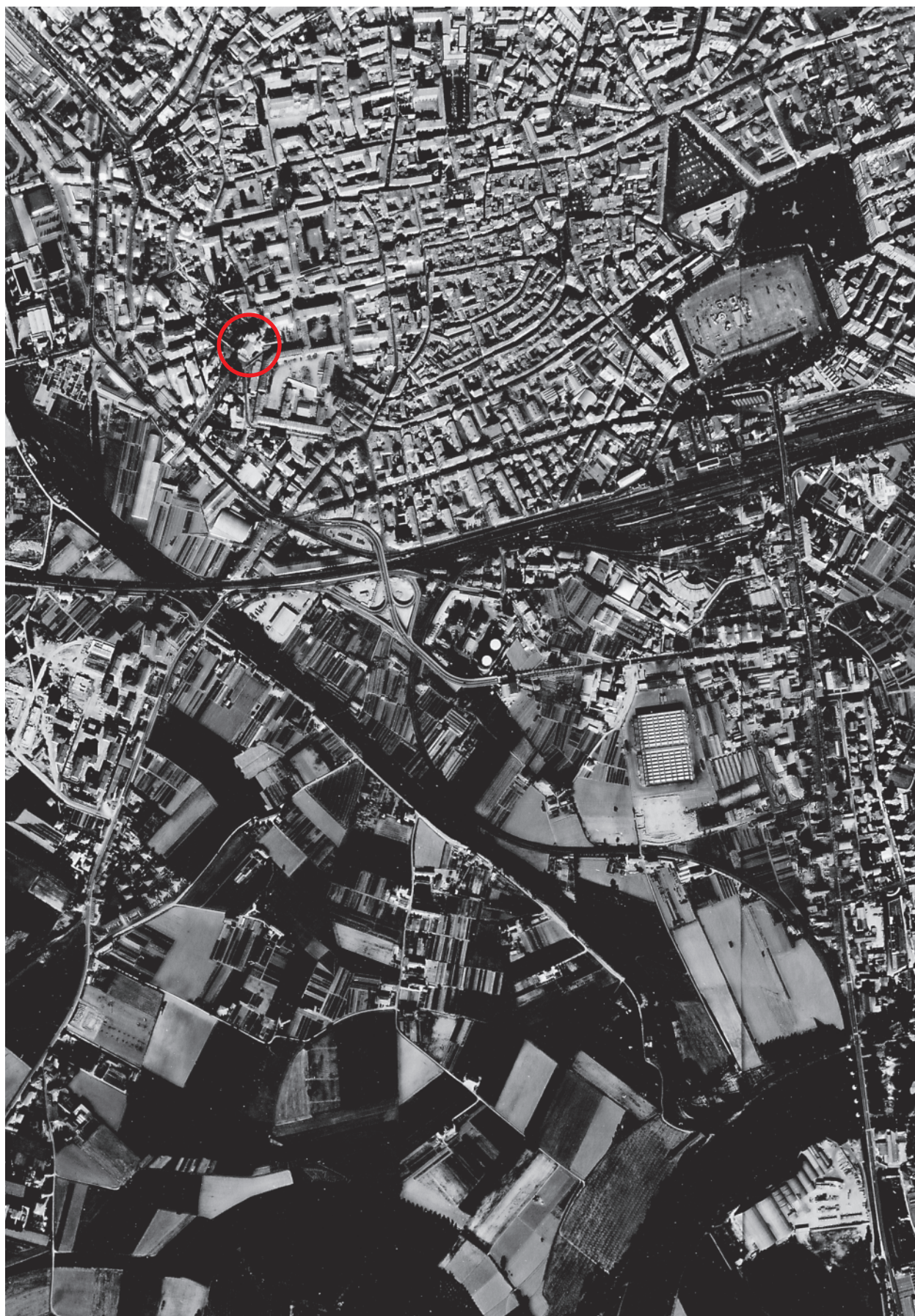
Asti, Santuario Madonna del Portone (indicato all'interno del cerchio rosso) nel contesto cittadino.