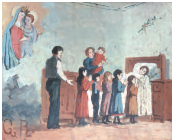
Castiglione Tinella (Cn), Santuario Madonna Buon Consiglio. La numerosa famiglia della miracolata è rappresentata in questo ex-voto dell'inizio del Novecento

La Tab. 3 riguarda la distribuzione di frequenza del ruolo ricoperto dal richiedente la grazia. Il ruolo predominante del richiedente riguarda ancora la figura della donna e infatti risulta essere nel 42,4% dei casi quello della casalinga. Dagli ex-voto emerge ancora una figura di donna relegata tra le mura domestiche, che assume quasi esclusivamente il ruolo di madre e di moglie e che vive sulla soglia di casa nell'attesa che l'uomo torni dalla guerra o dal lavoro dei campi. La condizione femminile così come viene proposta non è un'immagine reale, ma una visione deformata da una subalternità che la donna aveva nei confronti dell'uomo. Talvolta, in passato, il fatto che una donna lavorasse era addirittura motivo di discriminazione sociale (Grimaldi, 1980). La donna quotidianamente ha infatti sempre partecipato a fianco dell'uomo ai lavori della campagna, assolvendo al doppio ruolo. Le lunghe guerre hanno richiesto alla donna di condurre l'azienda agricola, subendo così gli stessi infortuni degli uomini. Altri ruoli rappresentati nelle tavolette votive dipinte sono quelli di famigliari (20,8%), di genitori (16,6%) e di marito-padre (11,1%), come possiamo notare si tratta di tutte persone appartenenti alla sfera delle relazioni famigliari.