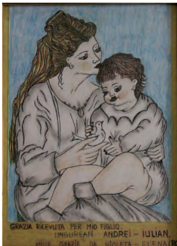
Tortona (Al), Santuario Madonna della Guardia (don Orione). Appaiono i primi ex-voto di immigrati da paesi dell'Est Europa come dimostra questo recente ex-voto di una donna della Romania