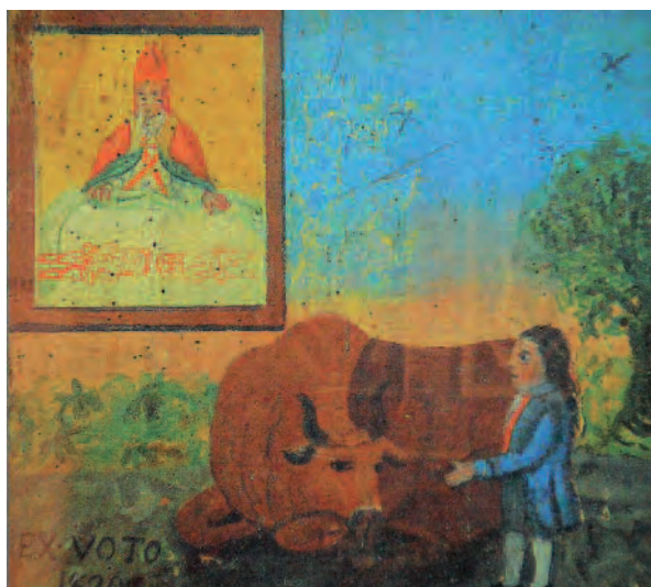
1820, Bene Vagienna (Cn), Cappella del Santo Sudario

Ad Avigliana (To), al Santuario della Madonna dei Laghi, un ex-voto del 1628 illustra la