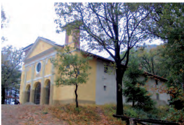
Caselette (To), Santuario di Sant'Abaco