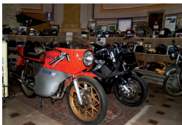
2008, Castellazzo Bormida (Al), Santuario Madonna di Creta (dei Centauri). Motociclette, caschi e indumenti da motociclista donati alla Vergine per grazia ricevuta