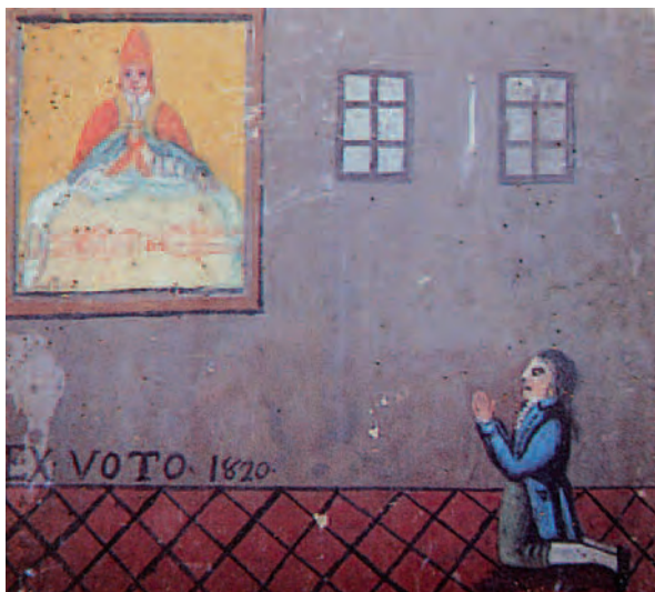
1820, Bene Vagienna (Cn), Cappella del Santo Sudario