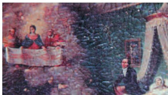
1817, Casalgrasso (Cn), Santuario Madonna delle Grazie, (Cn), particolare

processione della Reale Confraternita del Santo Sudario. Il Santuario contiene una tela di notevoli dimensioni riguardante la deposizione dalla Croce e in particolare raffigura il momento in cui Cristo è avvolto nel Sudario; potrebbe essere stato donato dal duca Carlo Emanuele I (1562-1630). Il Santuario ha origine dal Pilone della Madonna del Latte cui si rivolgevano le donne che non potevano avere la gioia della maternità o le balie che tramite l'allattamento di figli non loro traevano sostentamento per la famiglia. La tradizione vuole che a questo pilone pregasse Bona di Borbone, sposa di Amedeo VI, il Conte Verde; il suo voto fu esaudito (1362) e ciò spiegherebbe l'attenzione dei Savoia verso quello che diventerà il Santuario della Madonna del Laghi (Maffioli, 2011).