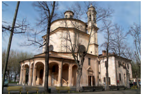
Crescentino (Vc), Santuario Madonna del Palazzo