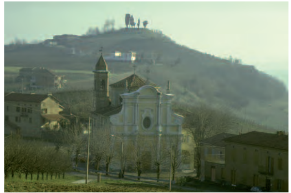
Costigliole d'Asti (At), Santuario Beata Vergine delle Grazie. Sullo sfondo, in alto, Bricco Lu