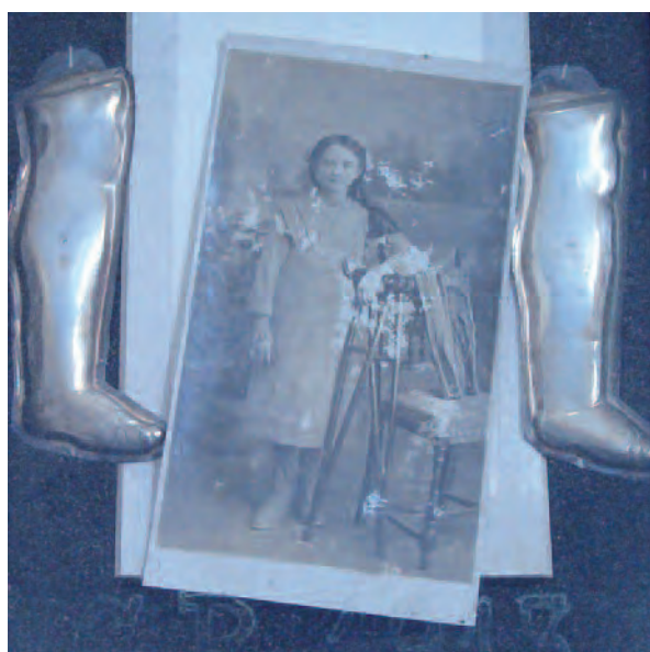
1913, Pianezza (To), Santuario di S. Pancrazio. Quadro votivo con ex-voto anatomici in argento e fotografia della miracolata che esibisce le stampelle ormai inutili

Le tavolette votive rendono in modo efficace il dramma vissuto, sottolineando i minimi dettagli per rendere riconoscibile all'intera comunità il graziato e l'evento straordinario a lui accaduto, ma anche la disperazione del momento, l'invocazione, la riconoscenza: nelle tavolette si possono ritrovare ogni tipo di sofferenza o incidente che raccontano i cambiamenti storici e culturali che ci accompagnano. Molti ex-voto manifestano richieste di aiuto per nuove nascite, neonati, ammalati, bambini incorsi nei più vari incidenti. Numerosissime anche le avvenute guarigioni da malattie: dagli infermi a letto, alle singole parti del corpo colpite e agli