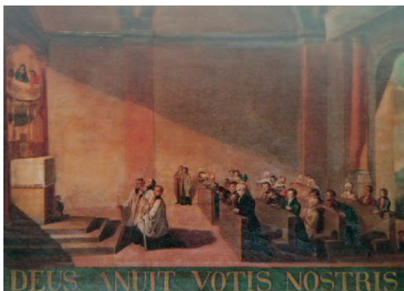
1850, Casalgrasso (Cn), Santuario Madonna delle Grazie