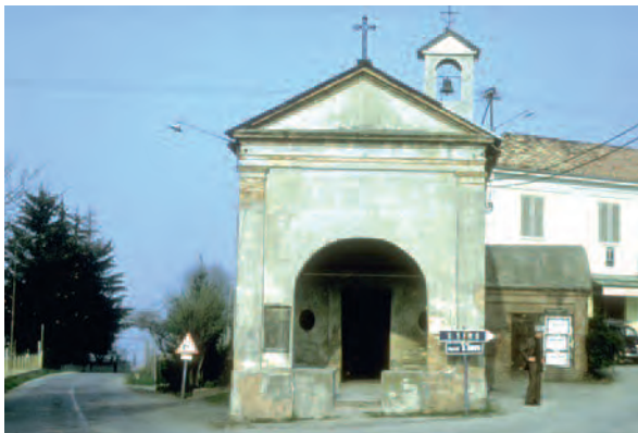
Calosso (At), Cappella di San Bovo