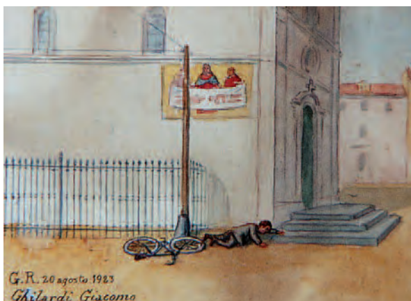
1923, Casalgrasso (Cn), Santuario Madonna delle Grazie