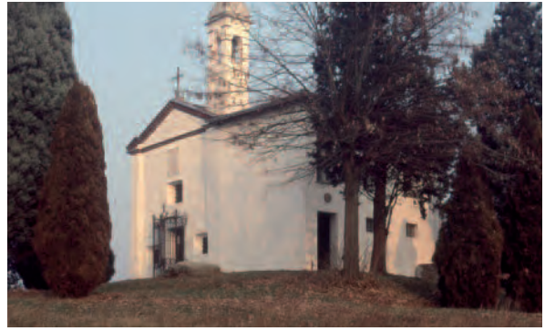
Villafranca (At), Chiesa Santa Maria di Vulpilio